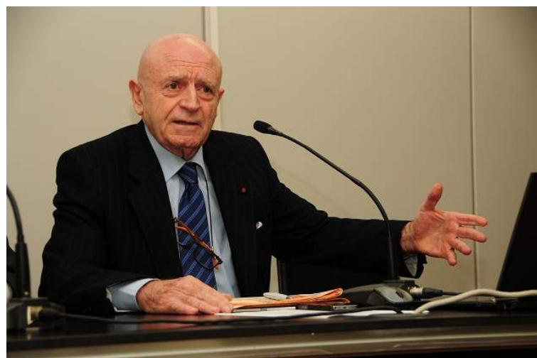
Abel Matutes, presidente de la Mesa del Turismo.

Más noticias sobre: TURISMO | ABEL MATUTES | SEGURIDAD SOCIAL | PIB | INE MACROECONOMÍA | SECTOR PÚBLICO